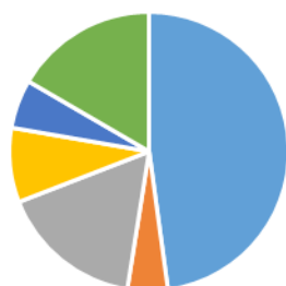
AFRT 78 BP 2018 Recettes